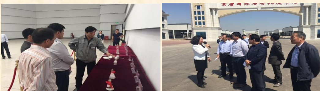
博士后科技服务团——河北唐山科技行