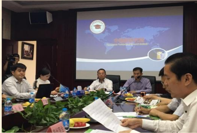
为福建商会讲授环保前沿科技课程

3、拥有百余名各行各业的优秀讲师，提供金融、环保、农业、管理、高新技术等领域的系列精品培训课程。