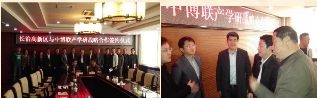
博士后科技服务团——山西长治科技行