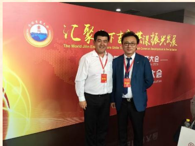
与吉林商会开展金融咨询培训合作