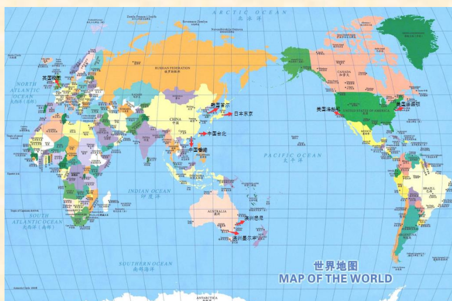
国际科技交流足迹

2、定期举办各行业前沿技术高端论坛和国际交流会议，与国际知名院校、五百强企业深入合作，组织国内精英赶赴海外学习先进经验，为企业转型升级提供科技助力。与香港的中华博士后联合会开展紧密合作，推动与港澳台、新加坡乃至整个大中华区的博士后、博士及博学之士进行学术交流、人才互访和科研项目合作，并联手开展慈善义卖、科技扶贫、植树造林等公益活动。与美国、日本、捷克等国家的知名大学和企业有良好的合作基础，积极展开合作互访、交流考察、及时了解其他各国的先进技术信息等，带动我们自己的产业链发展。