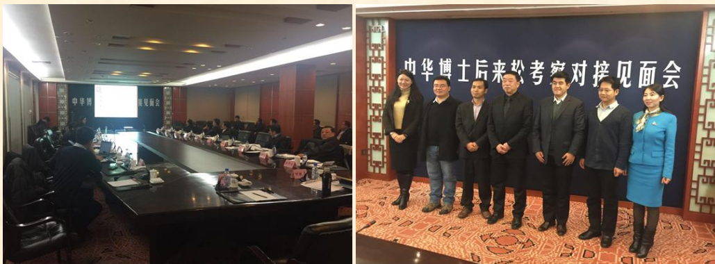
博士后科技服务团——吉林松原科技行